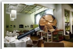
UITNODIGING VEILIGHEIDSAVOND 'Georganiseerde criminaliteit dichtbij' 9 OKTOBER