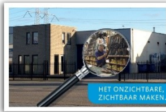
HET ONZICHTBARE, ZICHTBAAR MAKEN.