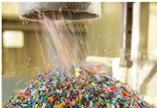
Plastic wordt gerecycled